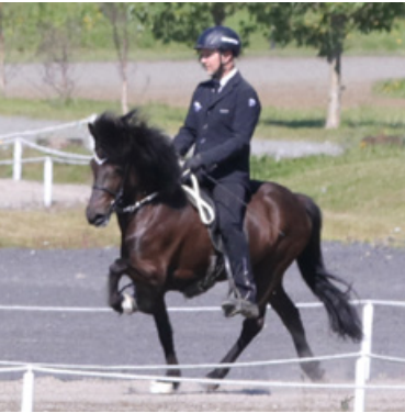
Vallarsól von Vellir