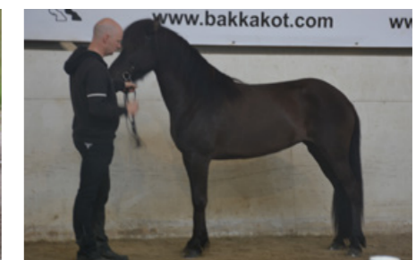
Sýr von Vellir