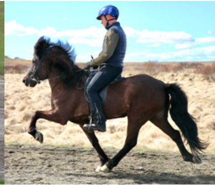
Nett von Vellir