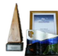
Im Jahre 2011 wurde Eldhestar der Umweltpreis des isländischen Fremdenverkehrsamtes sowie der Gemeinde Ölfus verliehen.