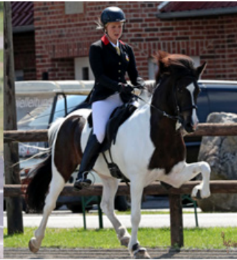
Hvammur von Vellir